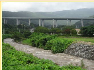
この写真から右2枚は、9月の北関東・東北を襲った豪雨災害と同時期の各河川の様子。上は、須津川新東名高速下。

田子の浦港は河口を利用した堀込み式港湾の宿命である、海からの沿岸漂砂や河川からの土砂が大量するために、港湾機能の維持保全のためには計画的な浚渫が必要である。港口の航路が埋まってしまう埋塞は、港湾工学の専門家の意見を聞きながら、防波堤設置等の沿岸漂砂の制御や航路を長期にわたり低コストで浚渫維持できる方法などの検討を進めている。港湾の浚渫コスト削減対策では、防潮堤整備などの公共工事への利用を検討しており、湖西市の命山に利用される。恒久的浚渫コスト削減のために、国、県、市、地元関係団体に参画いただき「第1回田子の浦港泊地維持恒久対策検討委員会」を先月開催した。根本的な課題である河川等からの港への流入土砂量の軽減に向けた発生源対策を検討していく。