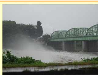
富士川旧国道富士川橋の上流側。左に見える森は水神。水煙が上がり、堰から流れ落ちる水流の強さがわかる。