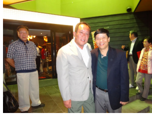
新しく着任した駐日ベトナム 全権大使グエン氏と