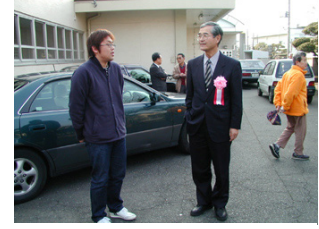
在りし日の故戸塚洋二氏 ニュートリノ研究第一人者