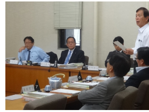
文教警察委員会委員長 として議事進行を担う