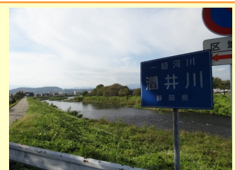
北関東・東北豪雨災害を受けて、各地の河川の課題調査が始まった。写真は潤井川中流域。調査結果は次回報告。