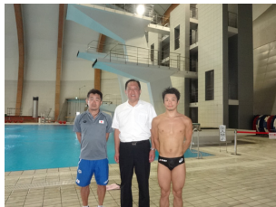
天井崩落事故から2年で 復旧した富士水泳場再開