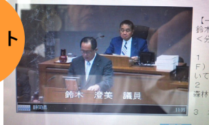
一般質問に登壇し、インターネットテレビで生中継