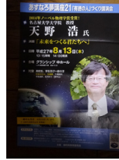
本県初ノーベル物理学賞 天野浩先生の講演聴講