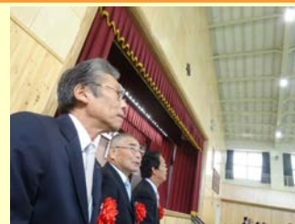
富士市立吉原第二中学校屋内体育館の落成式。財政難・少子化など今後の公共施設のあり方が大きな課題。