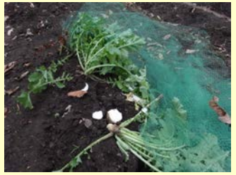
鳥獣害被害に苦しむ富士宮市山間部を視察。電気柵の効果等を検証し、地元の農家から課題をお聞きする。