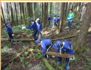
富士山麓森林で実施した環境教育「制水工」づくりに参加したボーイスカウト。荒廃森林・森の機能を自ら体験。