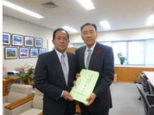
中小企業団体の次年度要望を経産部長に提出。