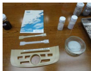
大手製紙研究所のサンプル

この議会報告「らしんばん9月議会号」で報告した、私の先進地への自主調査とその報告は、 本県のCNF支援への取り組みを後押ししていると実感しています。 12月定例会産業委員会の質疑では、10月に富士市で開催された全国規模のCNFサンプル企業展示会開催や、12月8日に本県主導のもと四国4県、京都市および産総研ナノセルロースフォーラムとの間で締結された相互連携、協力協定などが報告され、 そこに関わっている人脈や調査結果が物語っています。 今後、富士市内には大手製紙会社のCNF研究施設や実証設備が設置される報道もあり、 本県の弱点克服が一步前進しました。ライブワークとして取り組みます。