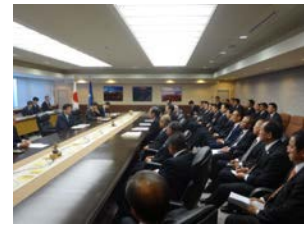
知事に対する会派次年度要望を提出し説明。