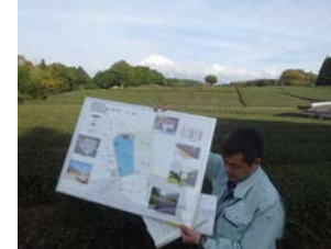
大淵笹葉地区の県による支援構想を現地視察。