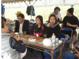
大淵地区文化祭取材したミャンマーTVクルー。