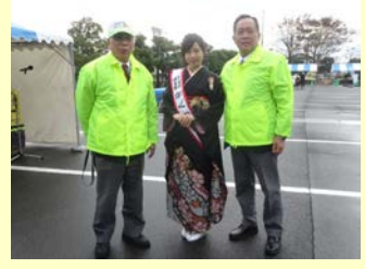
「ふじかわクイマラソン」の開会式。毎年4,000人近い参加者で賑わう。立ち上げてきた地元の皆さんに感謝。

いじめ防止等のための対策に関し、基本理念、県の責務等を定め、いじめ防止等のための対策を総合的かつ効果的に推進することにより、児童生徒が健やかに成長し、安心して生活できる環境づくりに寄与するための条例。