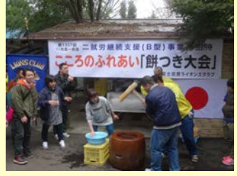
就労支援B型事業所の利用者を対象としたライオンズクラブ主催の餅つき大会。障害を持つ人達への理解が進む。