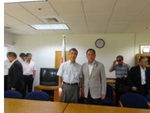
交流可能性について駐サイパン領事と意見交換。