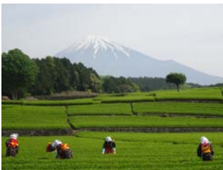
お茶がもたらす効果に期待。

本年6月定例会にける、私の一般質問「静岡県の茶農家の生き残りをかけた振興策について」の知事答弁は、この12月定例会で可決された「 小中学校の児童生徒の静岡茶の愛飲の促進に関する条例 」制定でした。