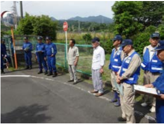
水防団と危険箇所を視察。

河床の浚渫や土手の整備など、地域からの要望の多い分野で、本格的な整備には多くの時間と事業費がかかることから、県民目線で気付く危険箇所に対し、対策を講じる事業。平成25年の12月定例会で私が台風18号の各地での被害に対し、未然の対策を求めたことがきっかけとなった事業。来年度以降も継続できるよう、強く知事に求めており、知事は重要性を認識して、平成29年1月末にその結果が出ます。