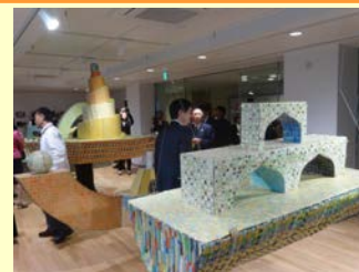
富士市ロゼシアターに開設された「ふじ・紙のアートミュージアム」。紙のまち富士市から発信する意義は大きい。