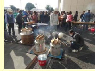
12月4日開催の地域自主防災訓練を視察。「大事な人。助ける前にはまず自分」の自助・共助の理解はまだ不十分。