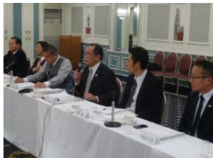
中小企業団体との次年度要望への意見交換会。