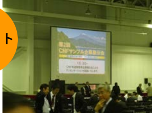
県が推進する全国規模C-NFサンプル企業展示会。