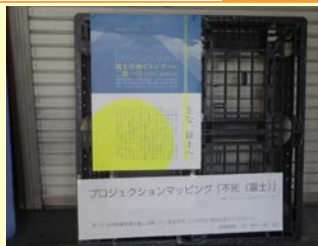
2020年東京五輪の文化プログラムの一つ「富士の山ビエンナーレ2016」。旧富士川町の会場を視察。