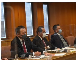
県財政当局との令和3年度予算折衝に挑む県連三役。