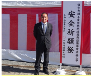
富士大淵工業団地の安全祈願祭。地域の期待は大。

私が数年前に市に提案した県との連携事業です。完成まであとわずかですが、6区画のところから12画の問い合わせがあり、進出企業が決定しました。本県初進出企業もあります。県が関わるメリットを実感しています。