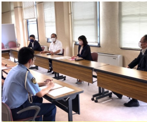
県道本市場大淵線の交通安全対策を県警に要望。

静岡県ではこの事故を受けて通学路の安全点検を行いました。安全対策については、道路管理者や警察などの行政機関がその責任で実施するものですが、その対策では実際に利用する地元関係者の意見は大変重要なものです。上記の3例はその教訓を生かし関係当局に強く改善を申し入れています。