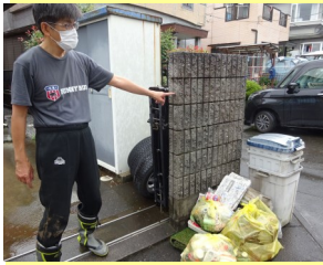
富士市江尾地区の浸水被害現場で住民の声を聴く。