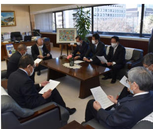
会派で副知事に新生児の難聴対策を強く申し入れた。