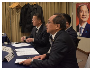
菅首相にコロナ対策や防災対策の財政支援を直訴。