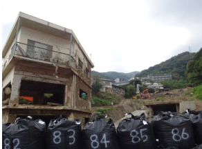
熱海市伊豆山地区土砂災害現場を視察。