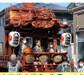
大改修を終え、住民への披露が行われた。

文化財の補修には多額の費用が必要です。地元要望にこたえるため、県を通じて国に支援を強く求めた結果、大改修が実現できました。完成後の式典において地元の皆さんの笑顔が忘れられません。