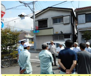
富士岡交差点改良事業が決定し地権者交渉が進む。