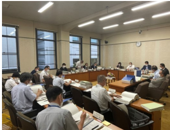
集中審査の様子。膨大な資料を隅から隅まで目を通し、許可済みとなった背景に問題が無かったか、当局を質す。

その他では、EV充電インフラ整備事業、技術専門校等施設改修事業費、農林水産業関連費、令和4年5月13日から大雨による被害復旧費などが審議され議決しました。