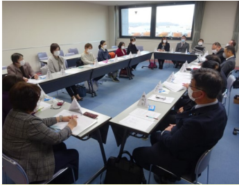
富士・富士宮地域の医療機関・介護施設に勤務する看護師の代表と意見交換。医師だけでなく看護師不足への対応が喫緊の課題

令和2年3月策定の「静岡県医師確保計画」では、本県の医師偏在指標は、県全体では全国39位で 医師少数県 とされており、二次医療圏の状況は、 中東遠、富士、賀茂が医師少数区域 です。