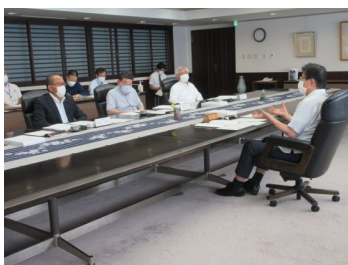
知事に対して監査結果に対する意見書を提出し、説明をした。審査過程における課題など、特記すべき内容を強調して説明。

静岡県監査委員に就任 し、本庁をはじめ県の出先機関や警察・県立学校などに出向き監査します。